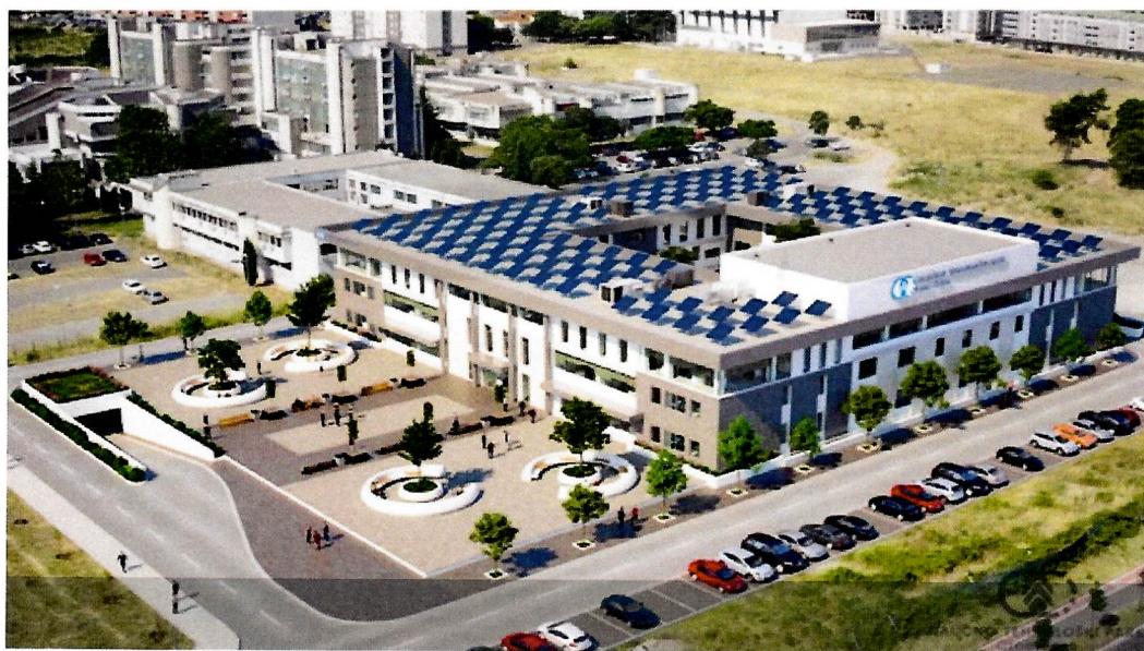
Izgled budućeg objekta Naučno-tehnološkog parka Crne Gore

NTP je u saradnji sa Ministarstvom nauke i UCG tokom decembra 2019 godine radio na uređenju prostora oko postojećeg objekta zgrade NTP kao i nabavke i ugradnje zaštitnog platna koje je postavljeno na zgradu NTP-a. Na ovaj način zgrada je dobila novi i prepoznatljiv vizuelni identitet sa jasnom vizijom budućeg izgleda. Objekat je na ovaj način sačuvan od propadanja do početka radova na njegovom završetku.